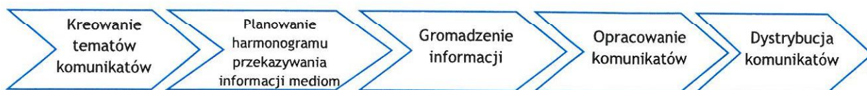
Rys. 2 Model pracy komórek odpowiedzialnych za działania informacyjno-promocyjne RPO - Lubuskie 2020

Zapytania dotyczące FE, wpływające ze strony mediów bezpośrednio do komórek odpowiedzialnych za działania informacyjno-promocyjne RPO - L2020 (w tym do Sieci PIFE) przekazywane są do Wydziału Informacji i Promocji Departamentu Zarządzania RPO. Wydział ten odpowiada na zapytania mediów 10 za pośrednictwem Biura Prasowego funkcjonującego w strukturze Gabinetu Zarządu UMWL.