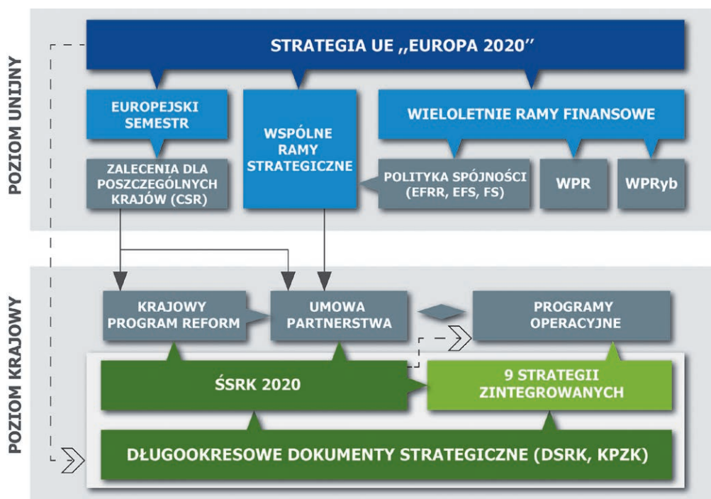
Schemat 2. Zależności i powiązania między dokumentami krajowymi i unijnymi

Efektywne wykorzystanie środków EFSI jest jednym z kluczowych warunków realizacji celów rozwojowych kraju, dla których w latach 2014–2020 fundusze europejskie stanowić będą istotne, ale nie jedyne źródło finansowania. Szacuje się, że w latach 2014–2020, ze środków unijnych zostanie sfinansowanych ok. 1/3 wydatków rozwojowych kraju.