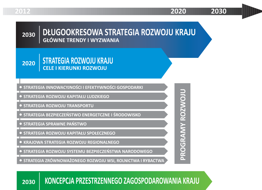
Schemat 1. System krajowych dokumentów strategicznych

Przewidziana w ramach tzw. Europejskiego Semestru coroczna aktualizacja KPR umożliwi elastyczne reagowanie na zmieniające się warunki realizacji priorytetów określonych w SRK 2020.