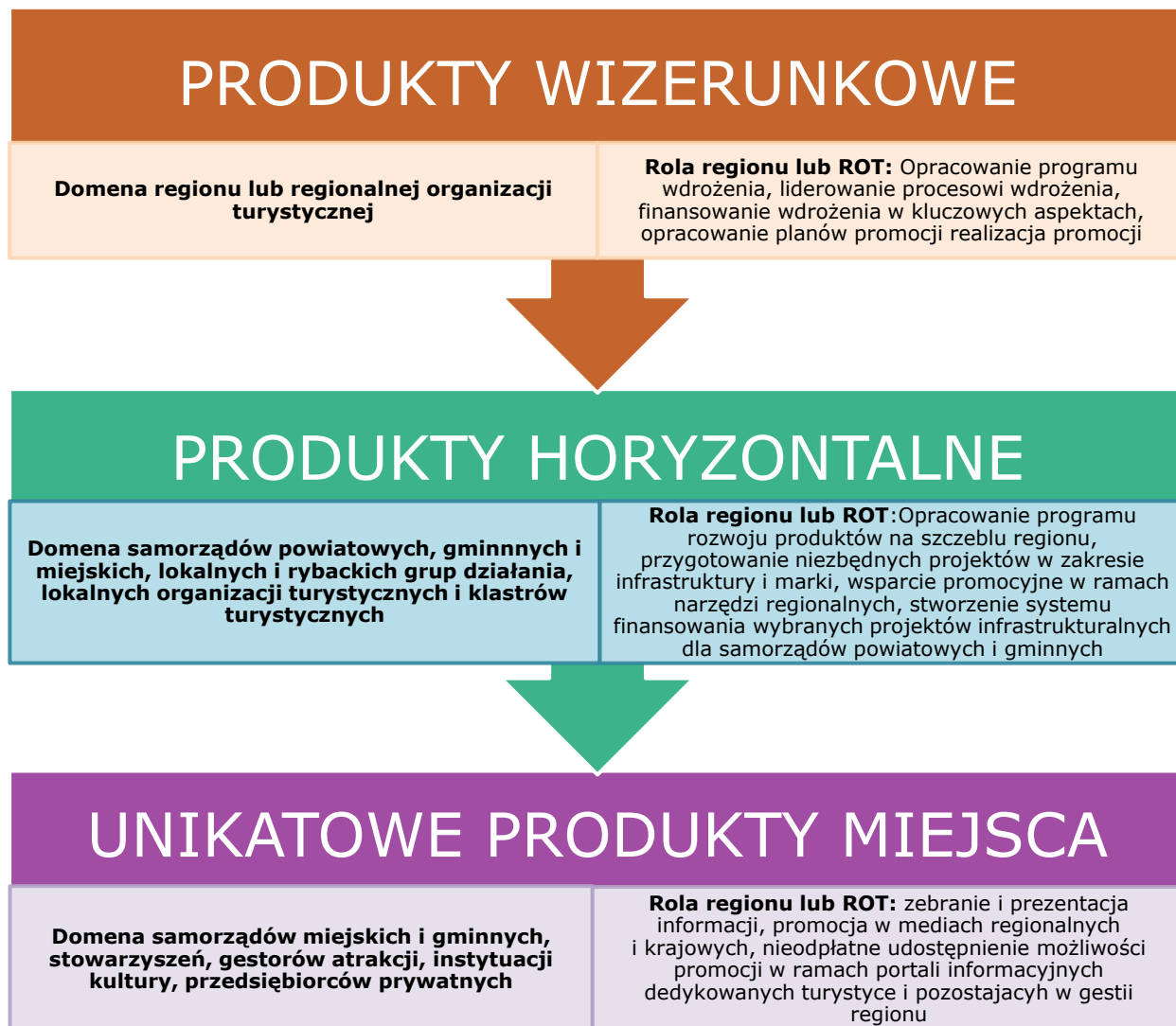
Schemat 4 Zaangażowanie jednostek terytorialnych i podmiotów z branży turystycznej w proces wdrażania poszczególnych rodzajów produktów