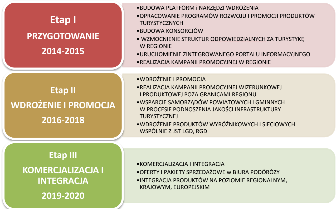
Schemat 3 Podział procesu realizacji Programu Rozwoju Lubuskiej Turystyki na etapy

Zakłada się realizację celów i działań zapisanych w Programie w ramach 3-etapowego procesu wdrażania. Każdy z etapów będzie nieco inaczej ogniskował wysiłek w procesie rozwoju funkcji turystycznej regionu. W pierwszym etapie, obejmującym lata 2014-2015, będzie miało miejsce przygotowanie wszelkich niezbędnych narzędzi i warunków do rozpoczęcia systematycznego i ciągłego wysiłku służącego rozwojowi funkcji turystycznej regionu. W drugim etapie, w latach 2016-2018, zostanie zrealizowanych większość działań wdrożeniowych i promocyjnych mających na celu dopracowanie oferty turystycznej regionu i jej odpowiednie ukazanie odbiorcom. W trzecim etapie, planowanym na lata 2019-2020, podstawowym wysiłkiem będzie prowadzenie działań służących skutecznej komercjalizacji oferty turystycznej regionu w skali kraju i zagranicy. W okresie tym będzie miała miejsce również daleko idąca integracja oferty regionu na poziomie krajowym i europejskim.