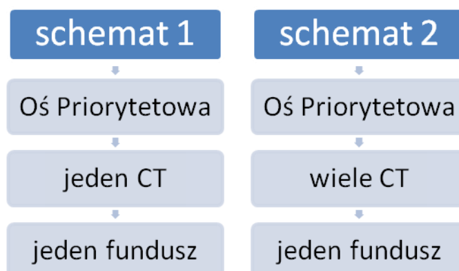
Rys. 3. Schemat logiki konstrukcji OP RPO-L2020.

Konstrukcja Osi Priorytetowych Regionalnego Programu Operacyjnego – Lubuskie 2020 została oparta na dwóch schematach (Rys. 3):